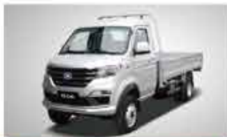
T5 CNG 2.5t Mini Truck