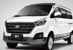
M3 Business MPV