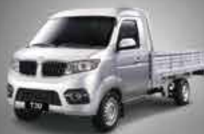
T3 1.5T Mini Truck