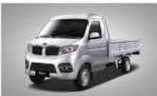
T3 EV 1.5t Mini Truck