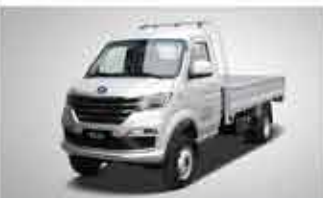
T5 EV 2.5t Mini Truck