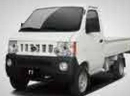
T1 1T Mini Truck