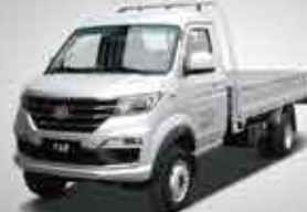
T5 2.5T Mini Truck