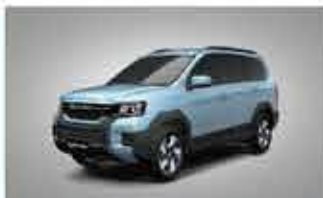
G03F EDi Entry-level SUV