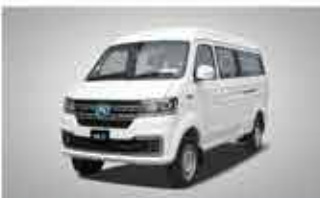
X30L EV Big Space Van