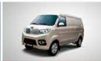
X30 CNG Economical Mini Van