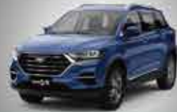
G01 Comfort City SUV