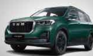
G05 Big Space SUV