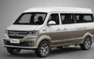
X30LS Business Van