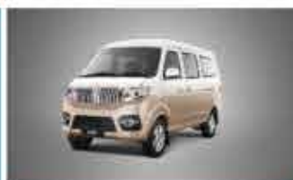
X30 Economical Mini Van