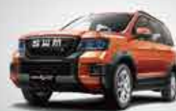
G03 F Junior Sports SUV