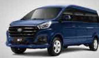
M7 Commercial MPV