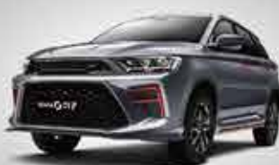
G01F Comfortable Sport SUV