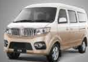
X30 Economical Mini Van