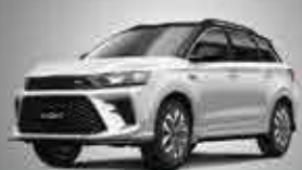
G01F Comfortable Sport SUV