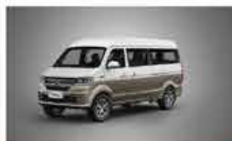
X30LS Business Van