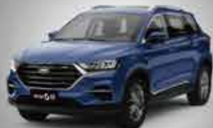
G01 Comfort City SUV