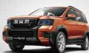
G03F Junior Sports SUV