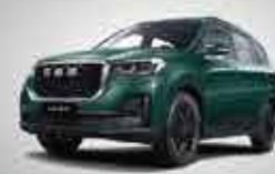
G05 Big Space SUV